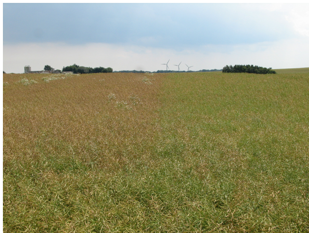
Billede 1. Vinterraps fotograferet 20. juli 2011. Til højre er der behandlet med 0,21 l/ha Matrigon + 0,21 l/ha Galera og 0,28 l/ha PG26N den 19/4.

Fra England berettes også om forsinket blomstring efter forårsanvendelse af Galera og i større omfang i 2011 end i tidligere år. I Finland er også set forsinket blomstring efter forårsanvendelse af Galera.